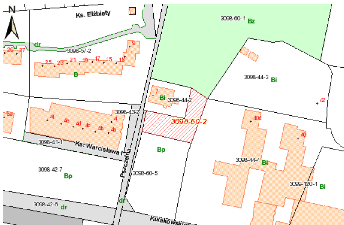
Mapa poglądowa działki nr 60/2 z obr. 3098 położonej przy ul. Pszczelnej