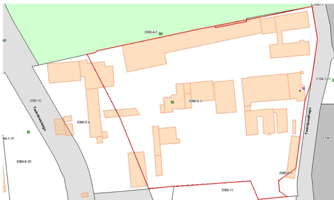
działki nr 5/3 i nr 4/1 o łącznej pow. 17.367m 2 obręb 1090 przy ul. Kazimierza Twardowskiego 18