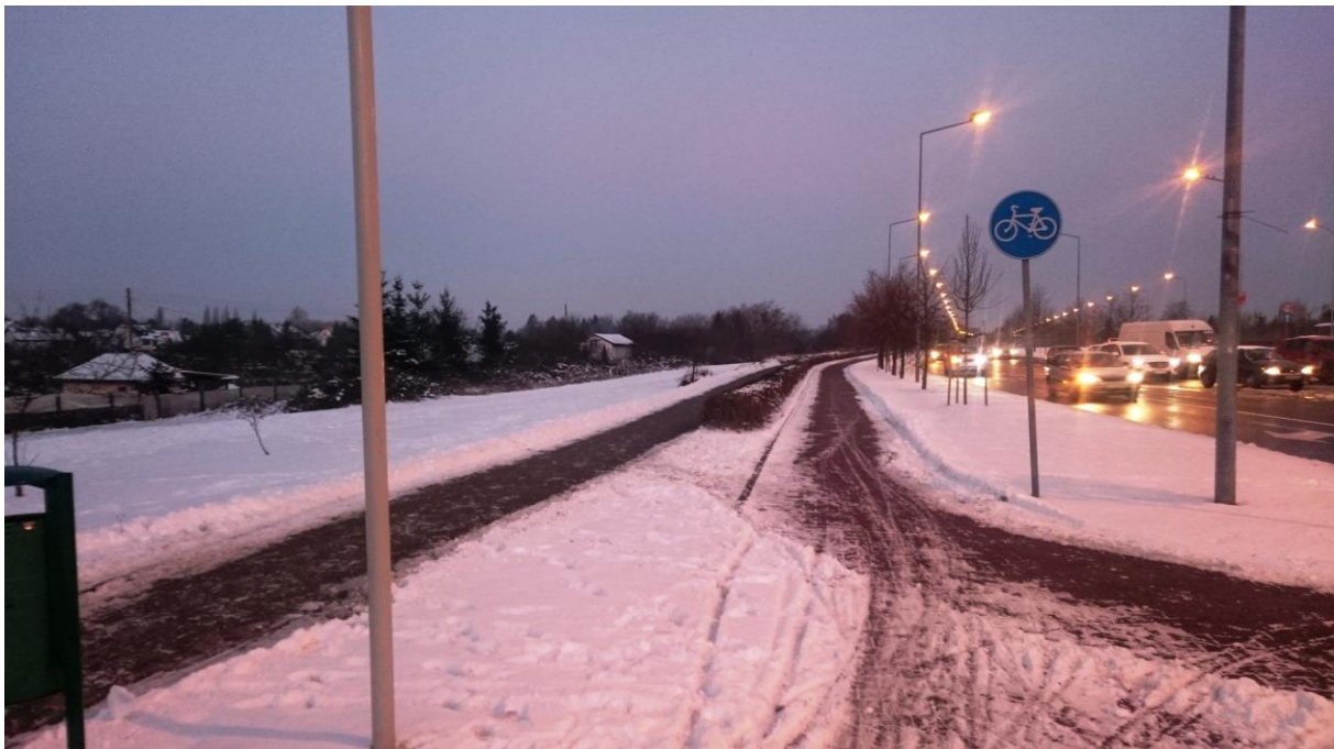
Odśnieżona ddr w ciągu ul. Taczaka

Przed około pięciu laty oddano do użytkowania drogę dla rowerów łączącą ul. Taczaka z rondem ks. Gierosa. Od tego czasu, jeśli osobiście nie zabiegam o odśnieżenie tego odcinka, nie jest on odśnieżany. Od tego też czasu mam obiecywane, że w końcu ten odcinek (podobno nienaniesiony na mapę sytuacyjno-wysokościową) będzie objęty zimowym utrzymaniem. Od tego mniej więcej również czasu, od zamknięcia przejścia dla pieszych przez ul. Derdowskiego i likwidacji prowadzącego do niego ciągu pieszo-rowerowego, odśnieża się nie wiadomo po co „ślepy” odcinek dawnego ciągu pieszo-rowerowego. Zwracam na to uwagę służbom permanentnie od kilku lat.