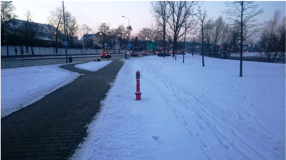
Nieodśnieżony odcinek ddr od w kierunku ronda ks. Gierosa na południe (z prawej od hydrantu); odśnieżony „ślepy” odcinek dawnego ciągu pieszo-rowerowego (z lewej od hydrantu)