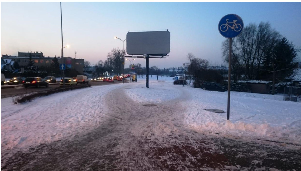
Nieodśnieżony odcinek ddr od skrzyżowania Taczaka - 26 Kwietnia / Derdowskiego na południe