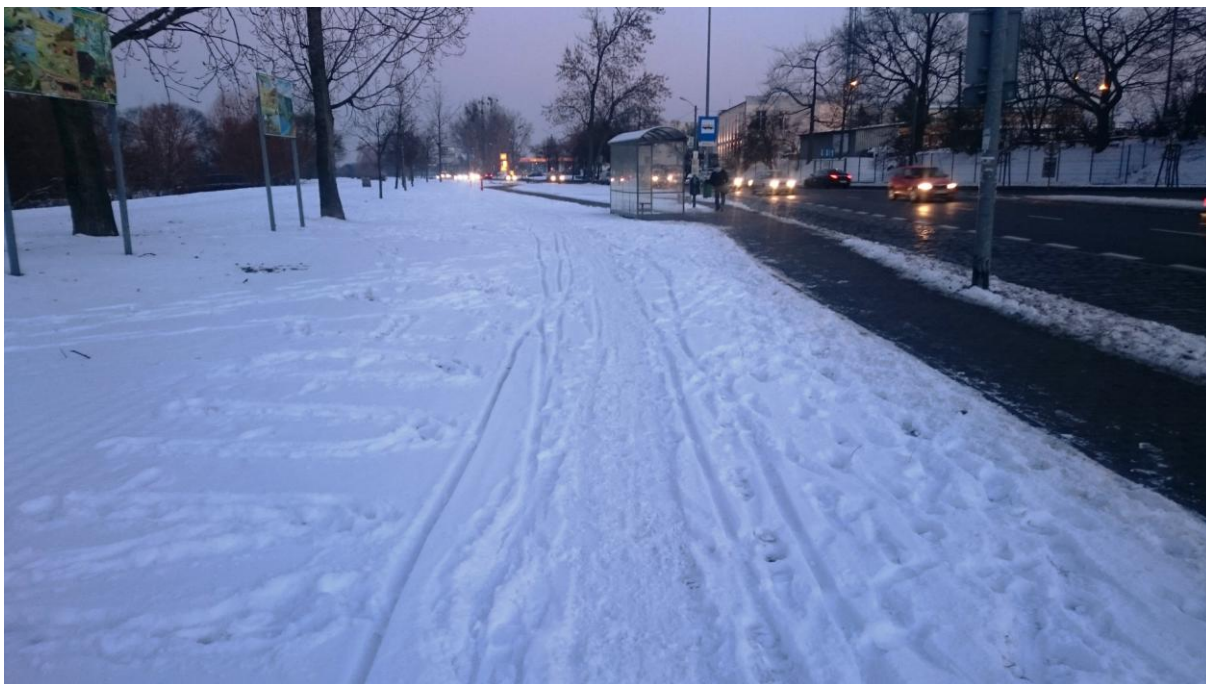
Nieodśnieżony odcinek ddr od ronda ks. Gierosa na północ