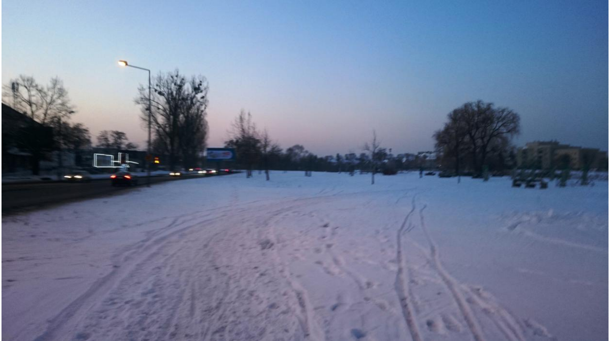
Nieodśnieżony odcinek ddr od wjazdu na parking przy jeziorku na południe