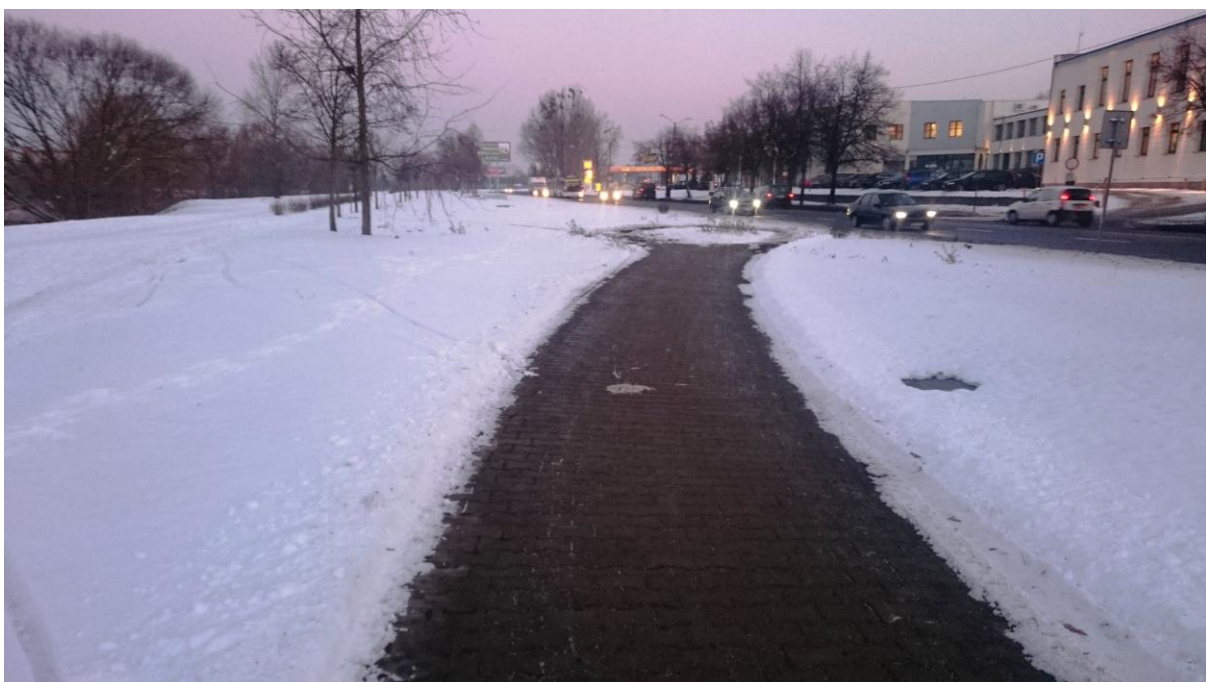
Odśnieżony „ślepy” odcinek dawnego ciągu pieszo-rowerowego z widocznym zakończeniem przed jezdnią ul. Derdowskiego

Ile jeszcze tego ręcznego sterowania najprostszymi rzeczami?!