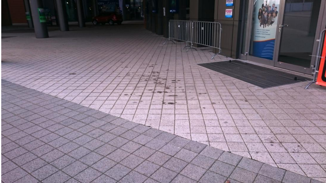
przestrzeń przed okienkami kasowymi - marzec 2016