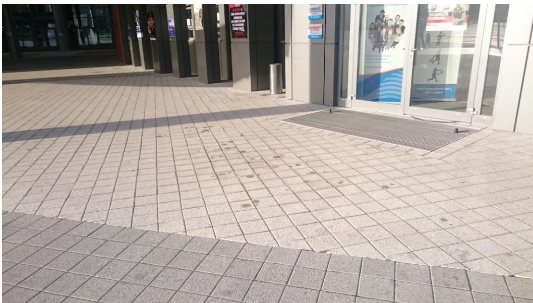
przeźrzęć przed okienkami kasowymi - listopad 2015

W dalszym ciągu, oczywiście już w innym miejscu, popękane są płytki na głównym placu przed halą. W dalszym ciągu również, mimo zapewnień o cyklicznym czyszczeniu nawierzchni, w pobliżu okienek kasowych znajdują się zabrudzenia pochodzące z płynów wyciekających z samochodów. Co więcej, plam jest optycznie dużo więcej niż przed czterema miesiącami, a do zabrudzeń w "starych" miejscach - tych samych, nie wyczyszczonych, doszły kolejne.