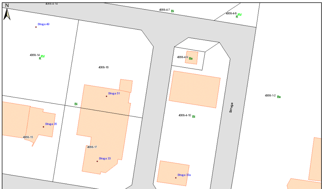
działka zabudowana nr 4/9 o pow. 135 m 2 obręb Dąbie-68