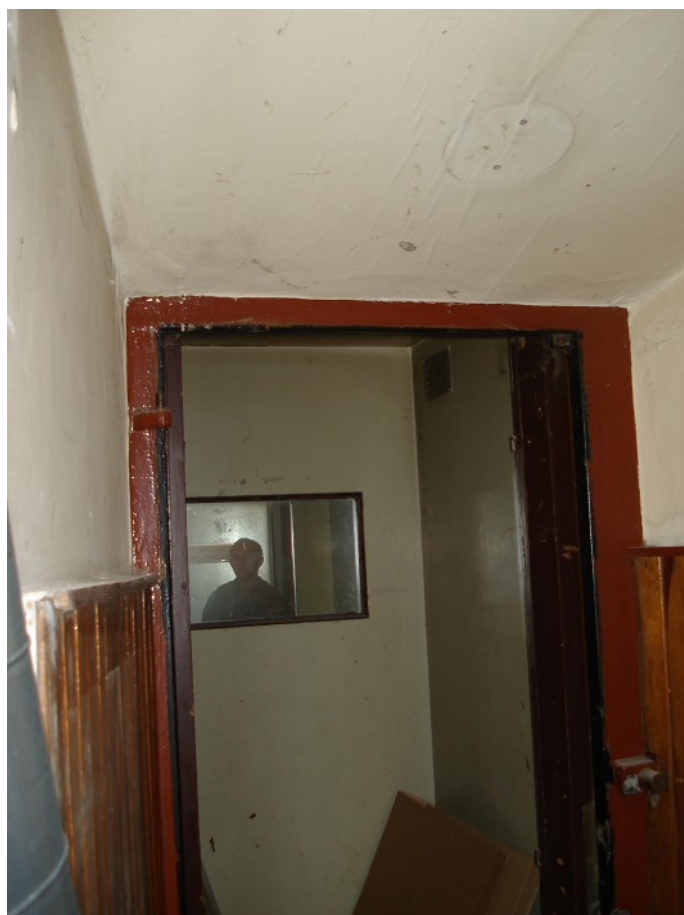
WNEKA PRZY SZYBIE-PARTER