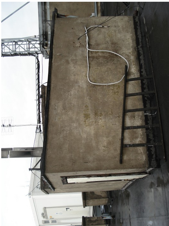
WYJŚCIE NA DACH