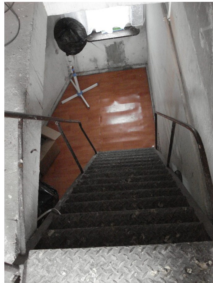
SCHODY WYJŚCIA NA DACH